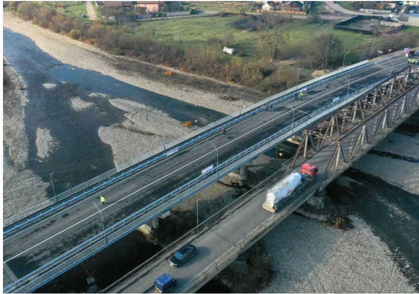
Міст через річку Теребля у селищі Буштино на Н-09 («Буштинський міст»)