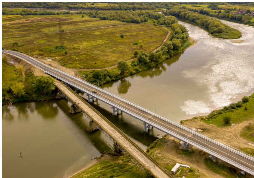
Міст через річку Дністер, Івано-Франківська область, дорога Т-09-10