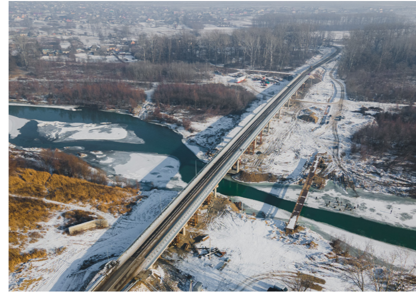
Міст через р. Прут у селі Маршинці на дорозі Т-26-06