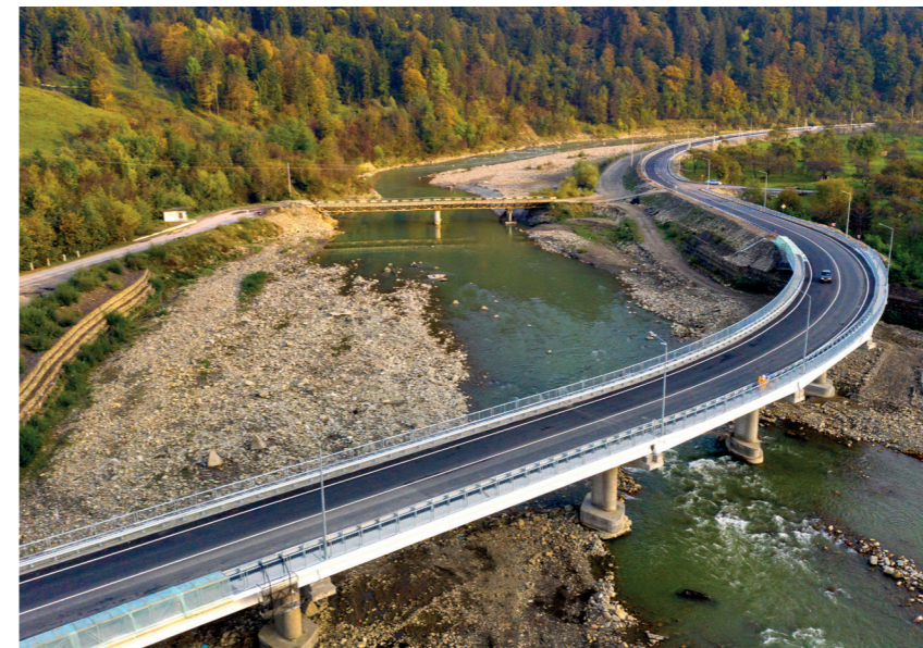
Міст в Розтоках, Чернівецька об- ласть, дорога Р-62 та інші